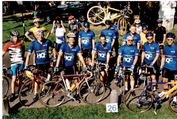
Signing up for the Broom wagon