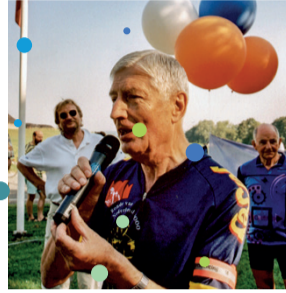
High visitor at the Classic: former prime minister Dries van Agt.