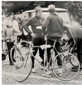
Nice vintage bikes. Back in the days when helmets were not compulsory.